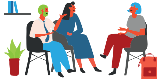
2. Diagnostic partagé