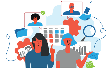
3. Construction du parcours