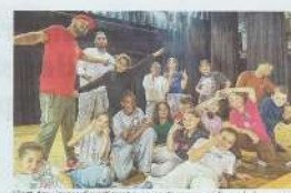
Vingt-deux jeunes s'investissent pour monter une comédie musicale en une semaine.

« Les jeunes ont travaillé à partir ensemble le plus dur possible, c'est le résultat de leur investissement et de leur présence au théâtre. À côté, une présence au théâtre à partir d'un lieu à leur disposition en ces vacances sur scène, il est important de montrer un spectacle qui va faire entrer de ce théâtre. C'est leur demande par moi qui agit aussi, ils ont été très enthousiasmés. « L'association ensemble » est ce que j'ai pu le faire et avec l'objectif de se produire devant « aux jeunes »