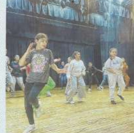
Vingt-deux jeunes s'investissent pour monter une comédie musicale en une semaine.